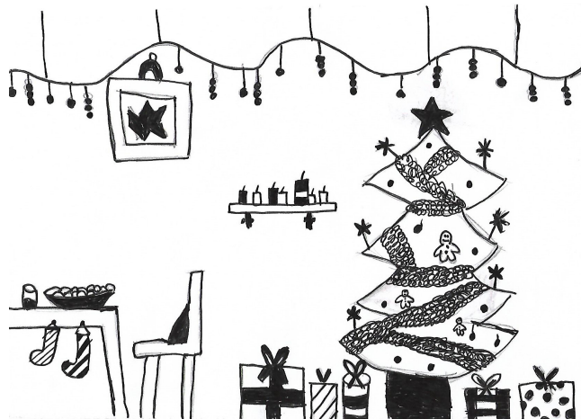
Rajz: Horváth Kitti